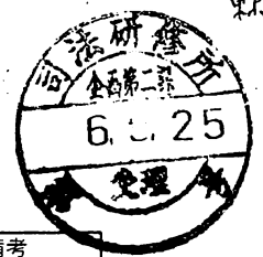
第77期4班司法修習生民裁日程一覧表