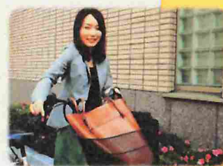
フットワークの軽さも重要です。

調査では、少年や保護者に面接したり、学校や児童相談所、保護観察所等を訪問したりします。また、 再非行防止 のために、少年等に対し、面接で指導したり、社会奉仕活動や被害者の視点を取り入れた講習に参加させたりするなどの働き掛けも行います。