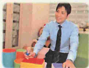
子どもが話しやすい雰囲気を大事にしています。