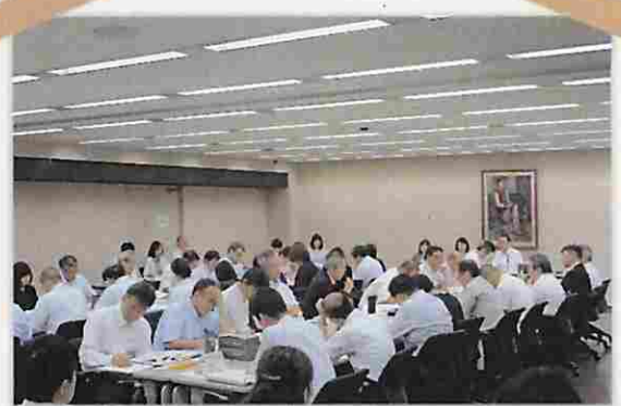
先進的な取組を行っている庁の取組 内容がたくさん紹介されました。

成年後見制度利用促進基本計画 を踏まえ、各家庭裁判所におい て取り組むべき運用上の課題