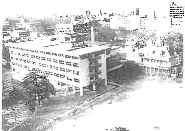
湯島庁舎 昭和46年～平成6年 ● Yushima Building (1971 to 1994)

August 2013: The section in charge of training and research of judges was moved to the annex of The Legal Training and Research Institute located in Wako City, Saitama