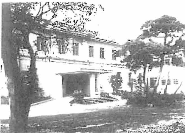
紀尾井町庁舎 昭和23年～46年 ● Kioi-cho Building (1948 to 1971)

July 1939: The "Legal Research Institute" was established in the Ministry of Justice (Shihosho)*