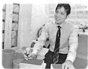
子どもが話しやすい雰囲気を大事にしています。