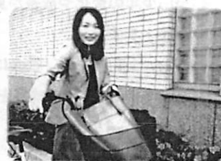
フットワークの軽さも重要です。

調査では、少年や保護者に面接したり、学校や児童相談所、保護観察所等を訪問したりします。また、再非行防止のために、少年等に対し、面接で指導したり、社会奉仕活動や被害者の視点を取り入れた講習に参加させたりするなどの働き掛けも行います。