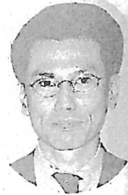
(細田制度調査室長)

ワークを構築し、民事訴訟事件の受付から終局までの手続全般を対象としたシステムとなります。