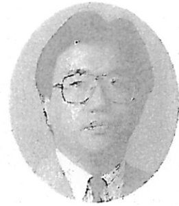
(鹿子木第二・第三課長)

なお、同時に出された「民事立会部における書記官事務の指針の解説」では、指針に掲げられた事務内容よりも進んだ運用を実践している例を紹介して、取組を更に進化させる際の参考に供することとしましたので、活用していただきたいと思