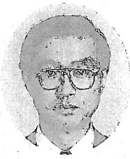
(小池第二・第三課長)

参事官室の提言は、将来の書記官事務の在り方について、「将来とも要領調書の作成を中心とする公証官としての役割を基本としつつ、民事、刑事、家事、少年いずれの分野においても、裁判官との密接な連携のもと、当事者等との接触を通じて訴訟等の進行に必要な様々な情報を収集管理し、訴訟等の円滑な進行を支えるコートマネージャーとしての役割を拡大強化する。」とされています。