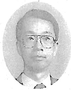
(永野第二・第三課長)

の書記官事務の在り方や裁判部の在り方等について具体的な検討を行うとともに、そこでの各種取組を部内に広く紹介することにより、事務改善に役立てる、言わばパイロットプランとしての位置付けを進めてきたものであります。したがって、モデル実験部等以外の裁判部においても、モデル実験部等の取組のうち参考となるものについては、できるものから試みていただきたいと考えており、このような趣旨から、これまでもモデル実験の取組状況を広く情報提供をしてきたところでありますが、今後もそのようにしていきたいと考えています。