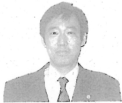
安東総務局第一課長

また、裁判員法上の各種手続の立件の要否、訴訟記録の編成方法等については現在検討を進めているところであり、今後、関連通達