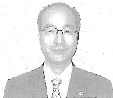
上田総務局第三課長

なお、総務局としては、今後も継続して見直す点がないか検討していきたいと考えています。各庁におかれても、昨今の事務処理状況を踏ま