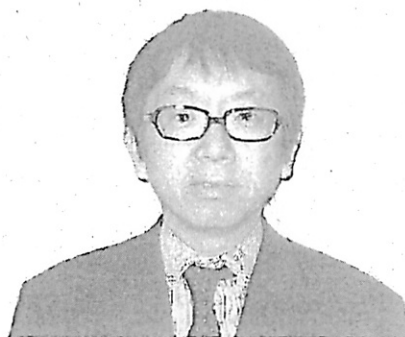
垣内人事局給与課長

級別定数、特に書記官の格付け関係についてお聞かせください。(7級関係、6級以下関係、官職増設関係)