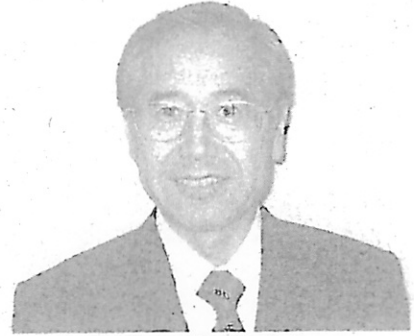
丸山人事局参事官

昨年度行われたCA試験（CA-2）では、全国で385人の受験申込みがあり、筆記試験、口述試験及び実務試験を経て最終合格した54人が、10月1日付けで書記官に任官しました（なお、