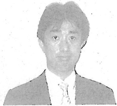
岡部情報政策課参事官

MINTASは、昨年の座談会でも概要をお話ししましたが、民事裁判事務における書記官事務について、その中核となる公証事務と進行管理事務に重点を置き、これを的確かつ迅速に支援するとともに、特に応答性の確保及び操作性が改善されたシステムとすることを目指し、平成18年4月から開発を進め、本年2月12日に第1次導入庁であるさいたま地裁に導入し、本格稼働を開始したところと ろです。開発にあたり、パイロット庁である東京地裁とさいたま地裁の職員の皆様には、帳票、画面、マ