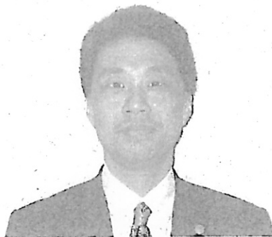
氏本総務局第二課長

音声認識システムについては、裁判員裁判での利用を念頭に置いて、裁判員裁判の具体的な運用等も視野に入れつつ、研究開発を進めていますが、裁判員裁判では、連日的に証拠調べが行われ、審理の後その記憶が鮮明なうちに速やかに評議が行われることから、公判調書を用いて証言内容を逐一確認する必要性は低く、むしろ、裁判員裁判に求められるのは、評議において、一般人である裁判員等が法廷における証言内容を確認する必要がある場合に、映像・音声によって迅速に証言内容を確認することのできるツールであると考えられます。そこで、音声認識システムにより得られた文字データを映像・音声データとリンクさせ、文字データをいわばインデックスとして利用することによって、証言等の中から評議での確認に必要な部分を検索し、速やかに映像及び音声で再現することを念頭に置いて、映像関連機能として盛り込むことを前提としてシステム構築を行ってきたところであり、これまでの研究開発によって、文字データを検索のためのインデックスとして利用する上では