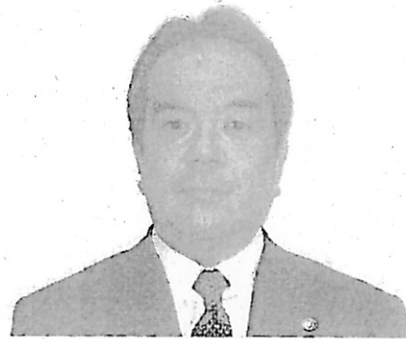
大竹人事局給与課長

級別定数の拡大を巡る情勢が年々厳しさを増していることから、今後の級別定数の拡大は極めて困難であること