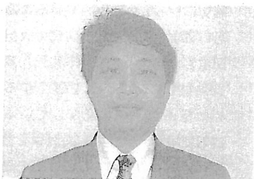
氏本総務局第一課長

裁判所においては、裁判員裁判の円滑な実施に向けて、裁判員法施行前から、人的態勢や執務資料の整備、通達等の発出など各種の準備を行ってきたところです。平成21年8月3日から4日間、東京地方裁判所