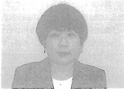
曾根総務局第三課長