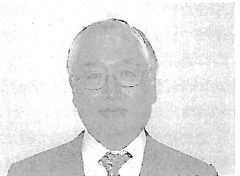
岸野人事局参事官