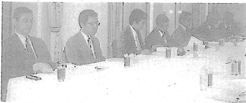
座談会風景（最高裁判所側）

現在、申立て等のうち、民事訴訟法その 他の法令の規定により書面等をもってす るものとされているものについて、当該法令 の規定にかかわらず、オンラインの方法を 用いてすることができるものとする「民事 関係手続の改善のための民事訴訟法等の一 部を改正する法律案」が国会で審議されて いますが、今後は、札幌地裁での利用状況