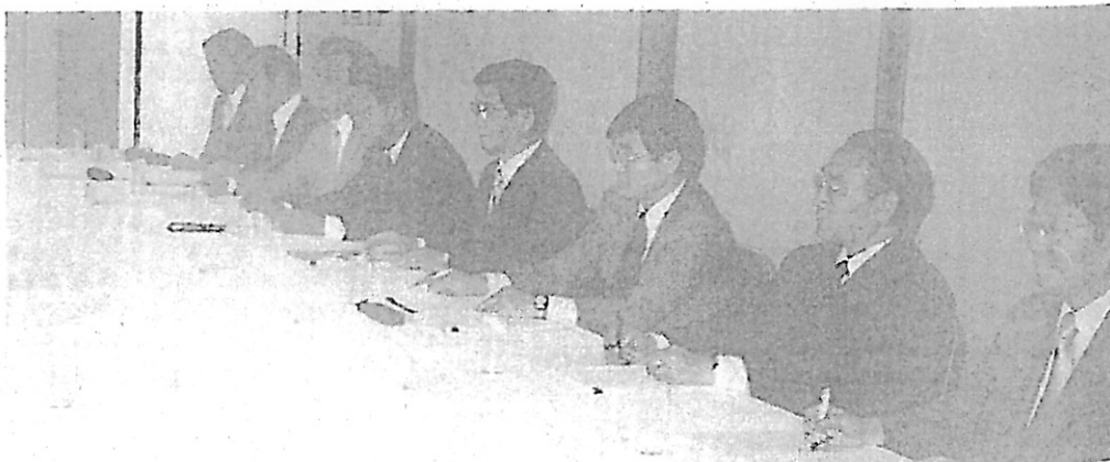
座談会風景（書記官協議会側）

情報化事務担当者が担当する事務についてですが、まず、業務の対象は、第1に、期日進行管理プログラム及び裁判事務処理システム、第2に、部内LAN（LANを構成するパソコン等の機器を含む。）。第3に、訟廷事務室に導入されたJ・NET端末等となっています。次に、業務の内容は、第1に、技術的な情報伝達の窓口として、制