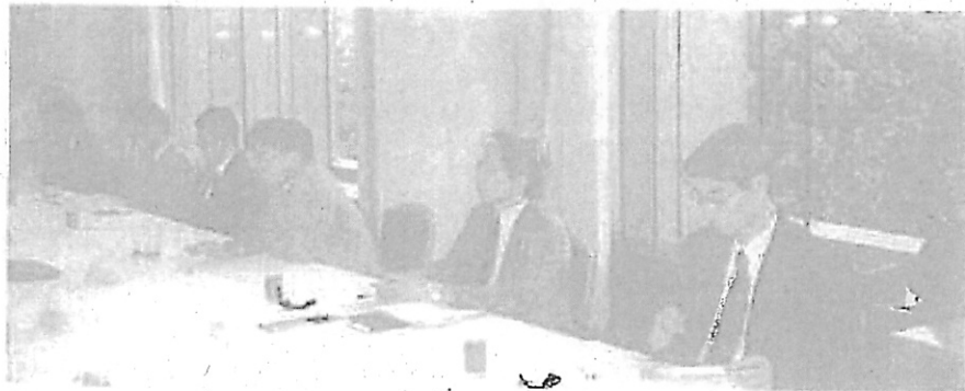
座談会風景(最高裁判所側)