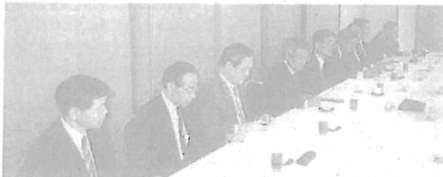
座談会風景(書記官協議会側)

情報化事務担当者に対しては、前述の事務を処理するために必要な知識・技能を修得してもらうために、書記官研修所において実施する情報処理研修に参加してもらうこととしています。