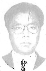
絹川制度調査室長

平成15年度には8庁に導入する予定であり、平成15年9月から10月ころにかけて千葉地裁、前橋地裁及び新潟地裁において、平成16年1月から2月ころにかけて神戸地裁、津地裁、山口地裁、福岡地裁及び山形地裁において、それぞれ稼働を開始する予定です。