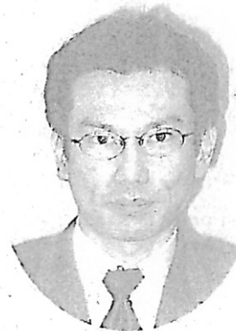
細田制度調査室長

システムで事件等の情報を一元管理することにより、事件簿、担当簿、期日簿等の帳簿がペーパーレス化されたほか、開廷表、出頭カード、呼出状等の帳票作成事務が大幅に省力化されています。