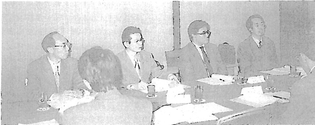
座談会風景（総務局関係）

ト事務 第1 判事 裁判 AN を含 れた 次 術的 調査 の伝 進行 等の 期日 第3 総 るシ サポ なり ます O 務を 得し 当者 参加