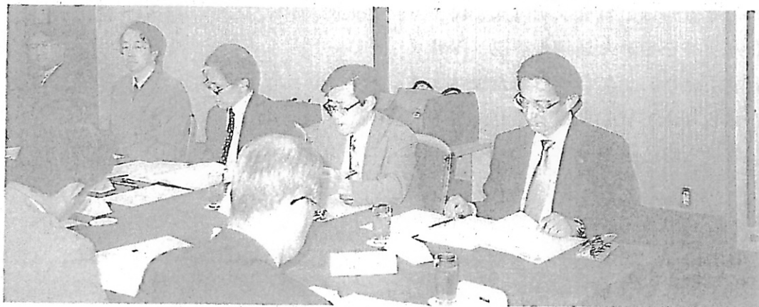
座談会風景(人事局関係)

それ以外の庁についても、OAサポート事務担当者のパソコン全体についての技術が、情報処理研修等を通じて向上したこと